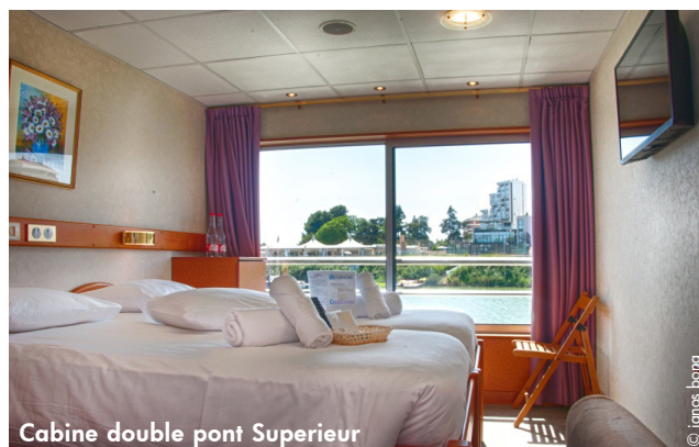
Cabine double pont Supérieur