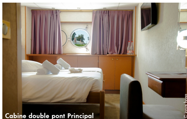
Cabine double pont Principal