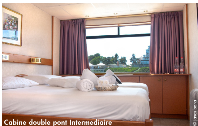
Cabine double pont Intermédiaire